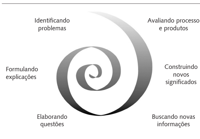
Figura 3. Representação esquemática da espiral construtivista

Em relação aos movimentos da espiral, a identificação de problemas, formulação de explicações e elaboração de questões de aprendizagem foram denominadas "síntese provisória". A busca por novas informações, a construção de novos significados e a avaliação constituíram uma "nova síntese" (Figura 3).