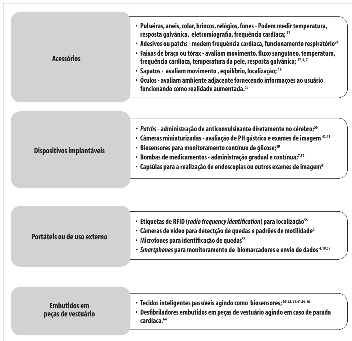
Figura 3 – Modalidades de hardware dos dispositivos vestíveis inteligentes