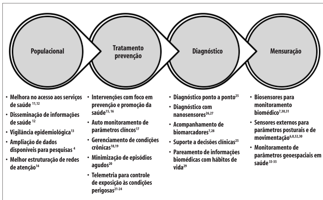
Figura 1 – Algumas possibilidades de aplicação da tecnologia de saúde móvel

assunto, tendo como parâmetro artigos completos, disponíveis no idioma inglês, publicados no período de 2000 a 2015, revisados por pares e que contassem com pelo menos um dos termos supracitados destacado no título do trabalho. Não foram empregados métodos de revisão sistemática da literatura.