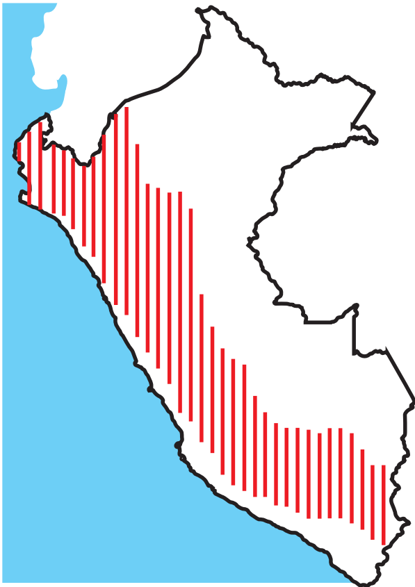
Figura 2. Mapa del Perú mostrando las principales áreas endémicas para teniasis/cisticercosis por Taenia solium

Entre 1990 y 1995, a partir de la introducción de la técnica serológica de western blot, se llevó a cabo una serie de estudios seroepidemiológicos en grupos poblacionales definidos, demostrándose seroprevalencias basales de entre 10 y 20% en población general, con valores dos a tres veces más altos en individuos con epilepsia, de las mismas regiones. Esta información confirmó el rol de la neurocisticercosis en la etiología de la epilepsia en zonas endémicas (10-12) . Basados en la procedencia de los casos clínicos y los estudios de prevalencia de nuestro grupo, estimamos como las zonas más claramente endémicas para NCC toda la sierra, la costa norte y la selva alta (Figura 2). Interesantemente, tanto la costa norte como la selva alta son focos receptores de migración de zonas endémicas de la sierra. La NCC está presente en menores cantidades en el resto del país, con Iquitos aparentemente libre de enfermedad, probablemente por su aislamiento del resto de departamentos. La teniasis se encuentra en promedio entre 0,5 a 1% de pobladores en áreas endémicas, con mayor prevalencia en jóvenes, mujeres embarazadas y ancianos. Hay pequeñas