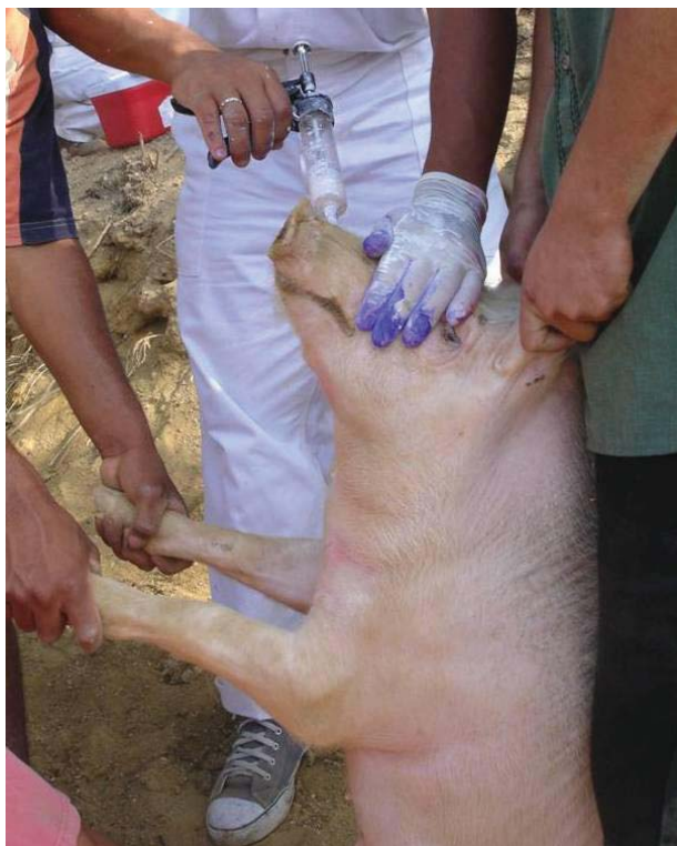
Figura 3. Administración de oxfendazole a un cerdo en el marco de un programa de control en el campo.

En la población porcina se usaron dosis orales de 30 mg/kg de oxfendazole. Esta droga se administró a todos los cerdos mayores de dos meses, presentes en las comunidades al tiempo de cada ronda de intervención (Figura 3). Adicionalmente, en colaboración con la Universidad de Melbourne en Australia, pudimos contar con la efectiva vacuna TSOL18 para la cisticercosis porcina. Esta vacuna, de eficacia cercana al 100%, se administró a todos los cerdos mayores de dos años, en dos dosis separadas por dos semanas.