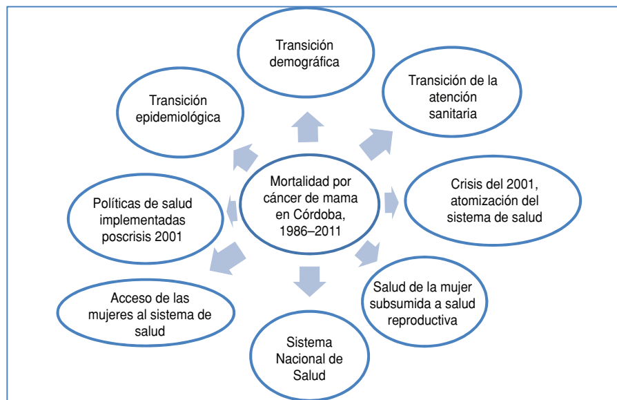
FIGURA 3. Ejes de análisis en torno a las tendencias de mortalidad por cáncer de mama en la provincia de Córdoba, Argentina, 1986–2011

2002 surge el Programa Nacional de Salud Sexual y Procreación Responsable (Pr.NSSPR), que fortalece a nivel nacional una política de salud con foco en la mujer. El Pr.NSSPR incluye como objetivos específicos contribuir a la prevención y detección precoz de patologías mamarias, y propone también potenciar la participación femenina en la toma de decisiones relativas a su salud. La creación de ambos programas posiblemente haya contribuido a un cambio favorable en la tendencia en la mortalidad por CM, dado que son medidas que promueven el acceso de la mujer a la atención sanitaria.