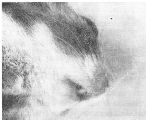
Figura 2 — A mesma lesão da figura anterior, vista ventralmente, para mostrar a pelada que a acompanhava.

Além dessas, a 28/IX/1972, procedeu-se à inoculação de um macaco da espécie Cebus apella sem, contudo, até o momento, ter-se verificado qualquer alteração macroscópica no local inoculado.