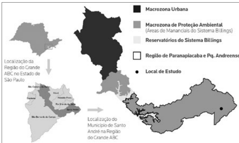
Figura 2 – Localização da Vila de Paranapiacaba

Tendo em vista os objetivos desta pesquisa, os resultados foram agrupados em dois blocos de análise: