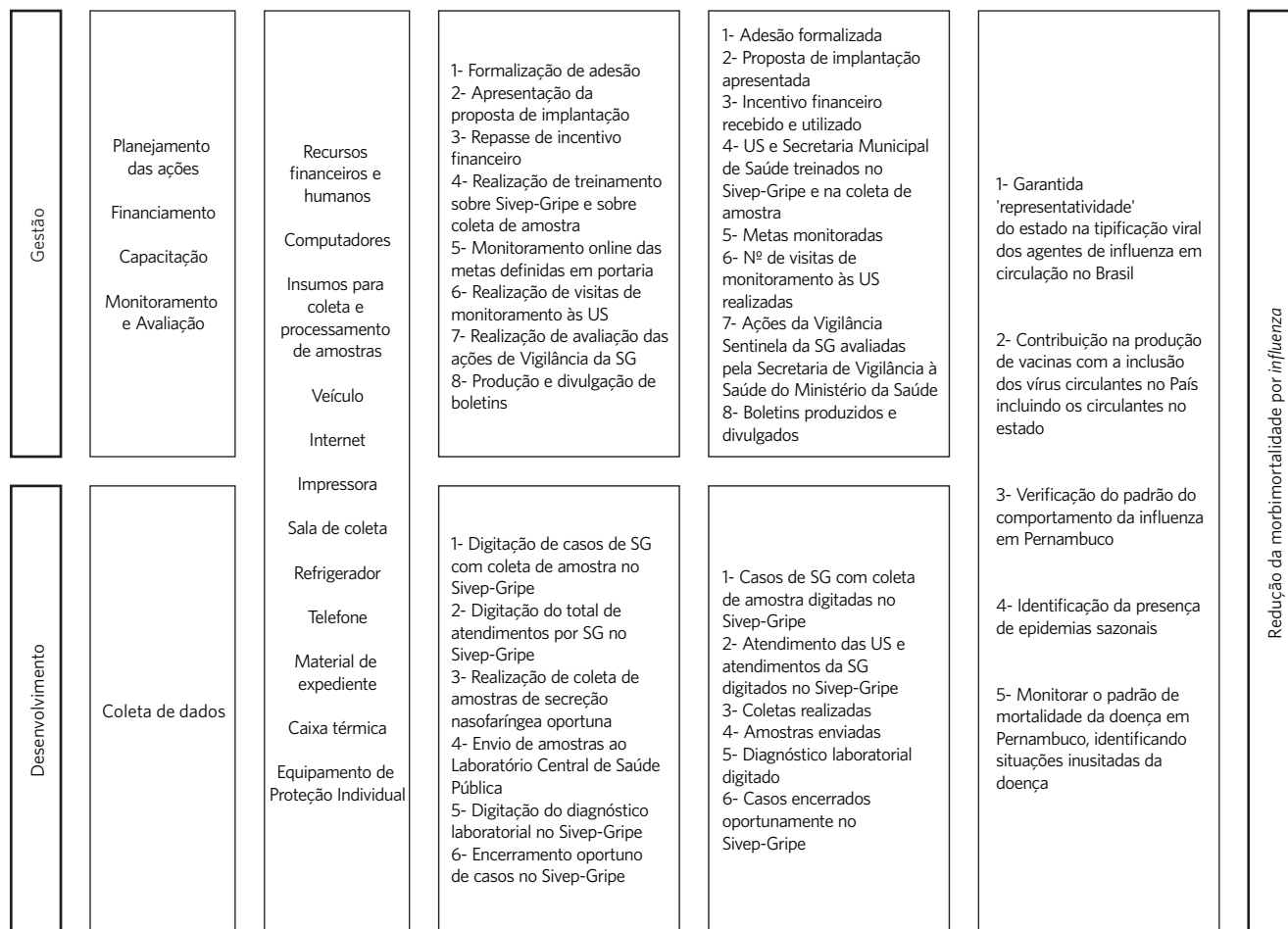
Figura 1. Modelo teórico-lógico da Vigilância da Síndrome Gripal em unidades sentinelas. Pernambuco, 2015